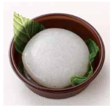
合わせ餅 1カップ 1個 希望小売価格：390円(税別)

【原材料】もち米粉加工品(国産)、砂糖、粉飴、寒天、 桜葉、塩【添加物】増粘多糖類、着色料(赤3、赤106) ◆栄養成分表示 1カップ(45g 当り) エネルギー54.1kcal / たんぱく質0.7g / 脂質0.1g 炭水化物12.6g / 食塩相当量0g(桜葉塩漬けは除く)