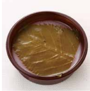
さくら餅 1カップ 1個 希望小売価格：390円(税別)

【原材料】砂糖、小豆生餡、粉飴、寒天 【添加物】トレハロース、増粘多糖類 ◆栄養成分表示 1カップ(50g 当り) エネルギー81.7kcal / たんぱく質1.0g / 脂質0.1g 炭水化物20.0g / 食塩相当量0g