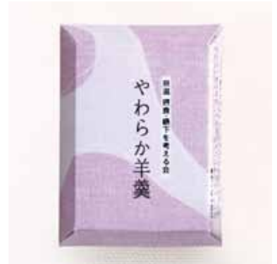
やわらか羊羹 1カップ 1個 希望小売価格：190円(税別)

【原材料】上白糖、白餡、米粉(国産)、醤油(大豆、食 塩、小麦)、でん粉分解物、寒天【添加物】加工でん粉 増粘多糖類、乳化剤 ◆栄養成分表示 1カップ(29g 当り) エネルギー41.3kcal / たんぱく質0.4g / 脂質0.1g 炭水化物10.0g / 食塩相当量 0.1g