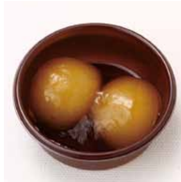
みたらし団子 1カップ 2個 希望小売価格：270円(税別)

【原材料】砂糖、小豆、もち粉加工品、寒天 しそ葉加工品(しそ葉、食塩) ◆栄養成分表示 1カップ(30g 当り) エネルギー52.57kcal / たんぱく質0.67g / 脂質0.04g 炭水化物12.68g / 食塩相当量 0.08g