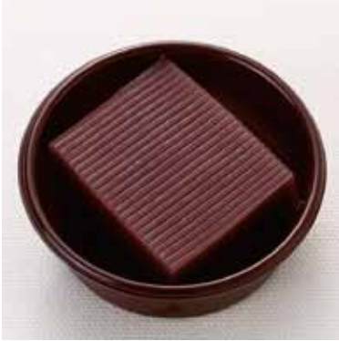
水ようかん 1カップ 1個 希望小売価格：330円(税別)

【原材料】砂糖、小豆生餡、粉飴、寒天 【添加物】トレハロース、増粘多糖類 ◆栄養成分表示 1カップ(50g 当り) エネルギー81.7kcal / たんぱく質1.0g / 脂質0.1g 炭水化物20.0g / 食塩相当量0g